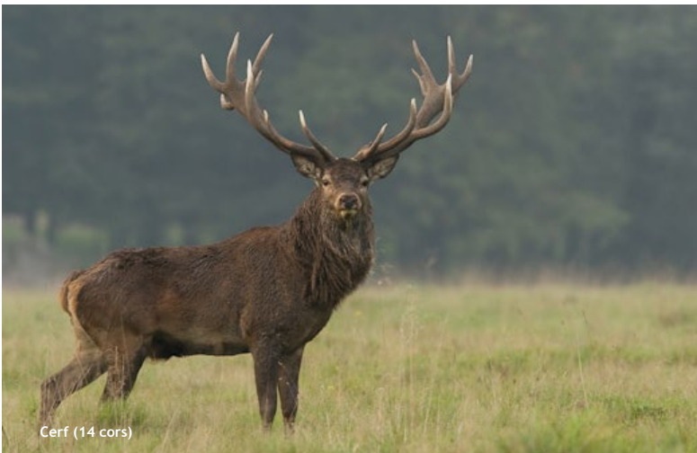
Cerf (14 cors)