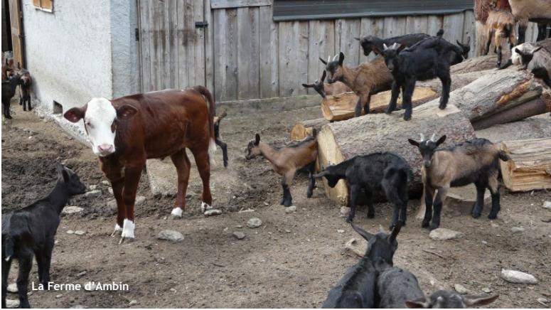
La Ferme d'Ambin