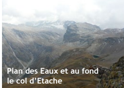
Plan des Eaux et au fond le col d'Étache