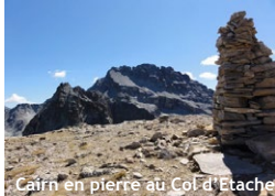
Cairn en pierre au Col d'Étache