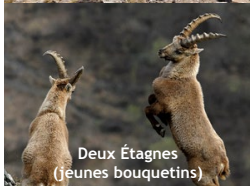
Deux Étagnes (jeunes bouquetins)