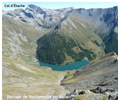
Barrage de Rochemolle en Italie

Choisissez un parcours adapté à vos capacités physiques et techniques. Choisissez un équipement adapté aux difficultés, à la durée, et aux conditions climatiques. Munissez-vous de bonnes chaussures. Emportez un vêtement chaud en toute saison. En été : lunettes de soleil, crème solaire, chapeau. Emportez une trousse de premiers secours. Prévoyez votre pique-nique, et une quantité d'eau suffisante. Il ne faut pas partir sans un itinéraire et l'heure approximative de retour. Ne partez jamais seul. Consultez le météo. Évitez de partir par mauvais temps. Sachez faire demi-tour en cas de changement de conditions climatiques. La carte de ce document est donnée à titre indicatif et ne remplace pas une carte IGN. Vous randonnez sous votre responsabilité et la responsabilité du refuge ne pourrait être engagée.