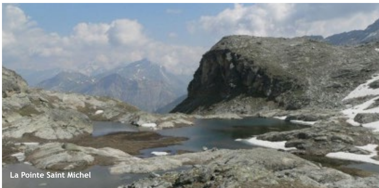
La Pointe Saint Michel