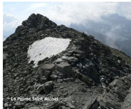
La Pointe Saint Michel