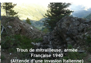
Trous de mitrailleuse, armée Française 1940 (Attende d'une invasion Italienne)

Choisissez un parcours adapté à vos capacités physiques et techniques. Choisissez un équipement adapté aux difficultés, à la durée, et aux conditions climatiques. Munissez-vous de bonnes chaussures. Emportez un vêtement chaud en toute saison. En été : lunettes de soleil, crème solaire, chapeau. Emportez une trousse de premiers secours. Prévoyez votre pique-nique, et une quantité d'eau suffisante. Il au moins par personne, voire 2 en été. Informez votre entourage de votre itinéraire et de l'heure approximative de retour. Ne partez jamais seul. Consultez la météo. Évitez de partir par mauvais temps. Sachez faire demi-tour en cas de changement de conditions climatiques. La carte de ce document est donnée à titre indicatif et ne remplace pas une carte IGN. Vous randonnez sous votre responsabilité et la responsabilité du refuge ne pourrait être engagée.