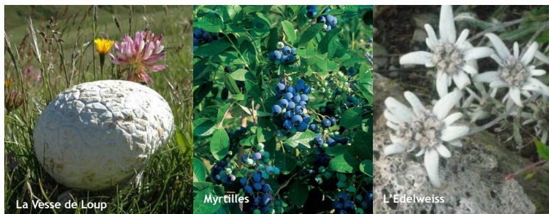
La Vesse de Loup