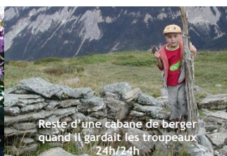
Reste d'une cabane de berger quand il gardait les troupeaux 24h/24h