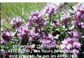
Le Serpolet et le Thym des Alpes ATTENTION : Les fleurs de montagne sont protégés, ne pas les ARRACHER