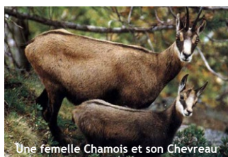
Une femelle Chamois et son Chevreau