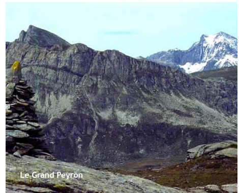
Le Grand Peyron