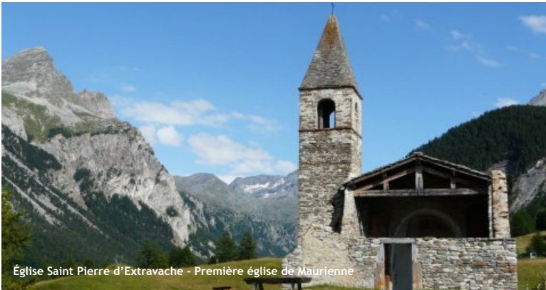
Église Saint Pierre d'Extravache - Première église de Maurienne

Selon la tradition, c'est à Saint Pierre d'Extravache que deux disciples de Saint Pierre, les saints Elie et Millet, auraient introduit le christianisme en Maurienne. Cela en ferait même la première église des Gaules! Sans remonter à une telle antiquité (l'édifice actuel succéda à un autre, détruit vers le 10ème siècle) c'est bien la plus vieille église de Maurienne. Et c'est sans doute la plus émouvante, peut-être parce que, détruite par un incendie en 1803, elle ne dresse plus vers le ciel qu'un clocher intact, quelques pans de murs et une abside de pierre et de lauzes. En perdant une partie de ses murs, elle n'en révèle que mieux son âme. Seule sur son promontoire avec pour toile de fond la Dent Parrachée, dans ce cadre grandiose, ce n'est pas une ruine, c'est toujours une église, sereine face aux injures du temps.