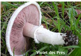
Violet des Prés