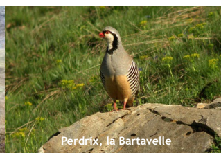
Perdrix, la Bartavelle