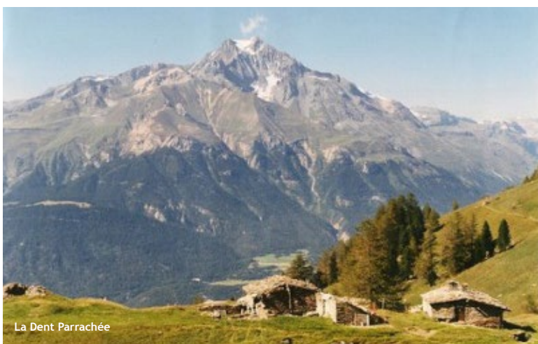
La Dent Parrachée

refugelotsamou@bbox.fr www.refuge-lotsamou.com