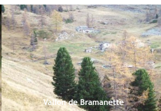
Vallée de Bramanette