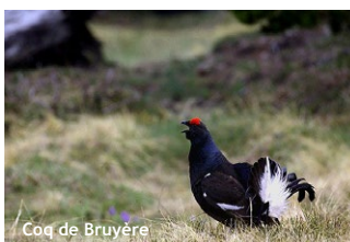
Coq de Bruyère

Choisissez un parcours adapté à vos capacités physiques et techniques. Choisissez un équipement adapté aux difficultés, à la durée, et aux conditions climatiques. Munissez-vous de bonnes chaussures. Emportez un vêtement chaud en toute saison. En été : lunettes de soleil, crème solaire, chapeau. Emportez une trousse de premiers secours. Prévoyez votre pique-nique, et une quantité d'eau suffisante. Il au moins par personne, voire 2 en été. Informez votre entourage de votre itinéraire et de l'heure approximative de retour. Ne partez jamais seul. Consultez la météo. Évitez de partir par mauvais temps. Sachez faire demi-tour en cas de changement de conditions climatiques. La carte de ce document est donnée à titre indicatif et ne remplace pas une carte IGN. Vous randonnez sous votre responsabilité et la responsabilité du refuge ne pourrait être engagée.