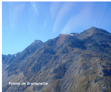
Pointe de Bramanette