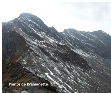
Pointe de Bramanette

Choisissez un parcours adapté à vos capacités physiques et techniques. Choisissez un équipement adapté aux difficultés, à la durée, et aux conditions climatiques. Munissez-vous de bonnes chaussures. Emportez un vêtement chaud en toute saison. En été : lunettes de soleil, crème solaire, chapeau. Emportez une trousse de premiers secours. Prévoyez votre pique-nique, et une quantité d'eau suffisante. Il ne faut pas partir par mauvais temps. Sachez faire demi-tour en cas d'incertitude et de l'heure approximative de retour. Ne partez jamais seul. Consultez la météo. Évitez de partir par mauvais temps. La carte de ce document est donnée à titre indicatif et ne remplace pas une carte IGN. Vous randonnez sous votre responsabilité et la responsabilité du refuge ne pourrait être engagée.