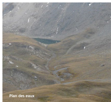
Plan des eaux

Choisissez un parcours adapté à vos capacités physiques et techniques. Choisissez un équipement adapté aux difficultés, à la durée, et aux conditions climatiques. Munissez-vous de bonnes chaussures. Emportez un vêtement chaud en toute saison. En été : lunettes de soleil, crème solaire, chapeau. Emportez une trousse de premiers secours. Prévoyez votre pique-nique, et une quantité d'eau suffisante. Il au moins par personne, voire 2 en été. Informez votre entourage de votre itinéraire et de l'heure approximative de retour. Ne partez jamais seul. Consultez le météo. Evitez de partir par mauvais temps. Sachez faire demi-tour en cas de changement de conditions climatiques. La carte de ce document est donnée à titre indicatif et ne remplace pas une carte IGN. Vous randonnez sous votre responsabilité et la responsabilité du refuge ne pourrait être engagée.