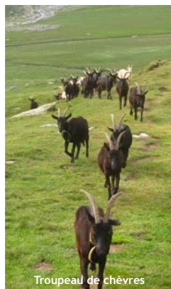
Troupeau de chèvres