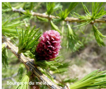
Bourgeon du mélèze

Découvrez une magnifique forêt où le soleil éclairera pin cembro et mélèzes, venez à la rencontre des chevreuils, des biches, des cerfs et des chamois solitaire.