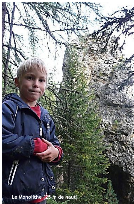
Le Monolithe (25 m de haut)