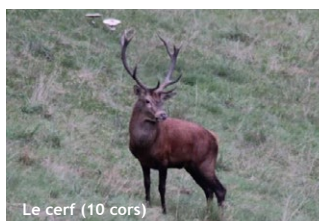
Le cerf (10 cors)