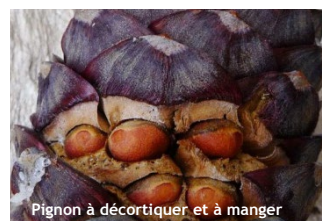
Pignon à décortiquer et à manger

Choisissez un parcours adapté à vos capacités physiques et techniques. Choisissez un équipement adapté aux difficultés, à la durée, et aux conditions climatiques. Munissez-vous de bonnes chaussures. Emportez un vêtement chaud en toute saison. En été : lunettes de soleil, crème solaire, chapeau. Emportez une trousse de premiers secours. Prévoyez votre pique-nique, et une quantité d'eau suffisante. Il au moins par personne, voire 2 en été. Informez votre entourage de votre itinéraire et de l'heure approximative de retour. Ne partez jamais seul. Consultez la météo. Évitez de partir par mauvais temps. Sachez faire demi-tour en cas de changement de conditions climatiques. La carte de ce document est donnée à titre indicatif et ne remplace pas une carte IGN. Vous randonnez sous votre responsabilité et la responsabilité du refuge ne pourrait être engagée.