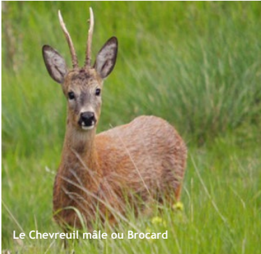
Le Chevreuil mâle ou Brocard

Depuis jadis jusqu'au XVIII siècles les fours de Colombière enlevaient les impuretés des minerais de la grotte de Colombière. Exploitation de plomb, de cuivre, de fer et aussi un peu d'or et d'argent.