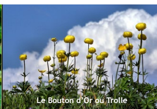
Le Bouton d'Or ou Trolle