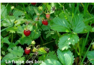
La fraise des bois