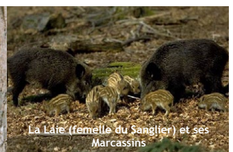
La Laine (femelle du Sanglier) et ses Marcassins

Choisissez un parcours adapté à vos capacités physiques et techniques. Choisissez un équipement adapté aux difficultés, à la durée, et aux conditions climatiques. Munissez-vous de bonnes chaussures. Emportez un vêtement chaud en toute saison. En été : lunettes de soleil, crème solaire, chapeau. Emportez une trousse de premiers secours. Prévoyez votre pique-nique, et une quantité d'eau suffisante. Il au moins par personne, voire 2 en été. Informez votre entourage de votre itinéraire et de l'heure approximative de retour. Ne partez jamais seul. Consultez la météo. Évitez de partir par mauvais temps. Sachez faire demi-tour en cas de changement de conditions climatiques. La carte de ce document est donnée à titre indicatif et ne remplace pas une carte IGN. Vous randonnez sous votre responsabilité et la responsabilité du refuge ne pourrait être engagée.